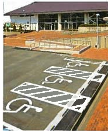
Omaezaki City Hall